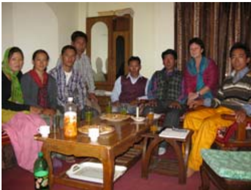
Réunion des membres d'HWL Inde et France été 2011