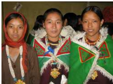
Jeunes Femmes en costume traditionnel

Cette année, pour accéder au Spiti, nous avons emprunté la route traversant le Kinnaur nécessitant un permis pour les étrangers, la frontière Inde-Tibet étant très sécurisée. En effet, la route de Manali avec le passage du col Rothang Pass à 3900 m d'altitude était très difficile d'accès en cette période de mousson. 4 jours de route et pistes caillouteuses de Delhi à Kungri.