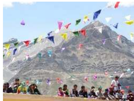
Festival d'été, occasion de se réunir