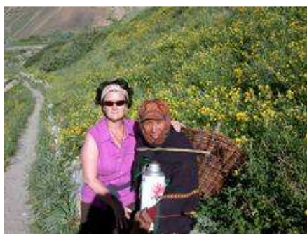
Transport des combustibles dans la hotte