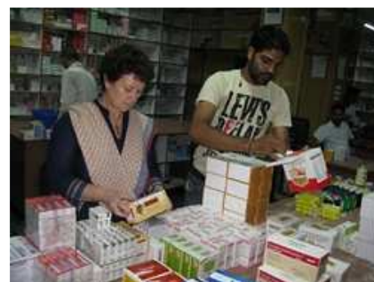
Chez Gupta Medical Agency à Mandi, contrôle des dates de péremption