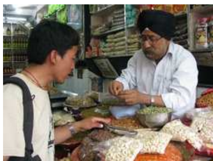
Achat des matières premières au marché Chandi Chock de Delhi