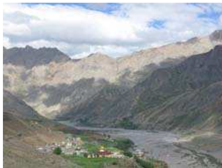
Village de Kungri, Pin Vallée au Spiti i – 3800 m