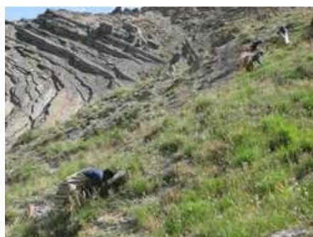
Collecte de bouses de yack