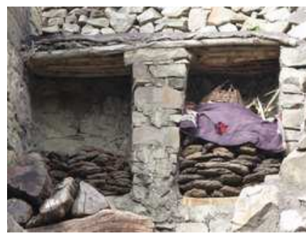
Stockage du combustible pour l'hiver

Cette nouvelle aventure humaine a été riche d'expériences.