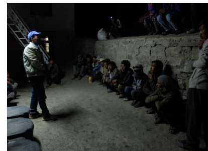
Vote : ouverture pharmacie à Mud