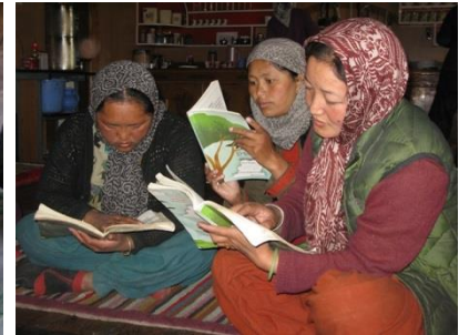
Classes de Bhoti dans différents villages de la Pin vallée et de la Spiti vallée