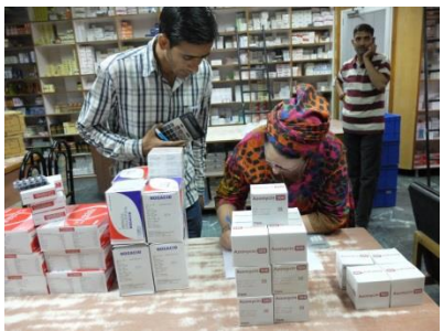
Chez Gupta Medical Agency à Mandi