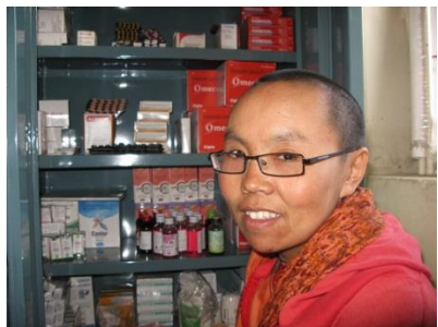
Pharmacie Dechen monastery